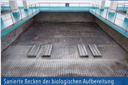
Sanierte Becken der biologischen Aufbereitung