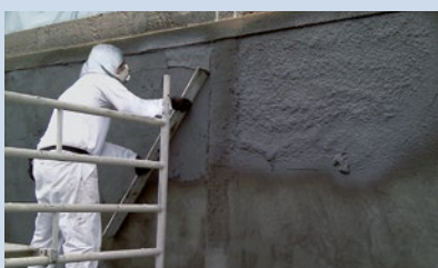
Egalisieren der Ausgleichsschicht