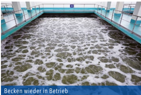
Becken wieder in Betrieb

Die zementgebundenen Vandex Produkte erfüllen die erforderlichen EN 1504 Normen für Betonreparatur und Schutz