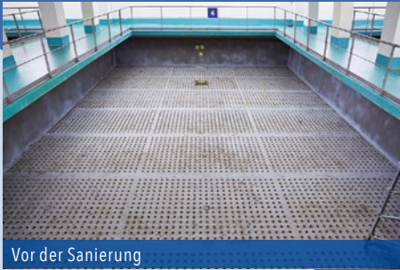
Vor der Sanierung